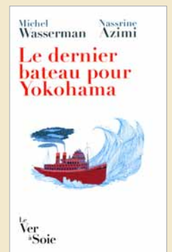
Le Ver à soie éditeur, 2013