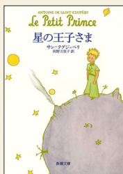
サン＝テグジュペリ著 河野万里子訳 『星の王子さま』（新潮文庫刊）