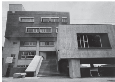
お茶の水に新館を改築 Nouveau bâtiment à Ochanomizu