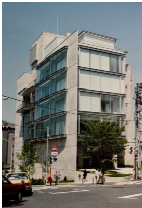
お茶の水から 恵比寿に移転 Déménagement d'Ochanomizu à Ebisu