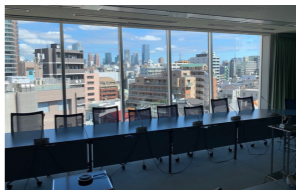
601号室から見える風景 Vue depuis la salle 601

17 h 40 Discours de clôture Philippe SETTON (ambassadeur de France au Japon)